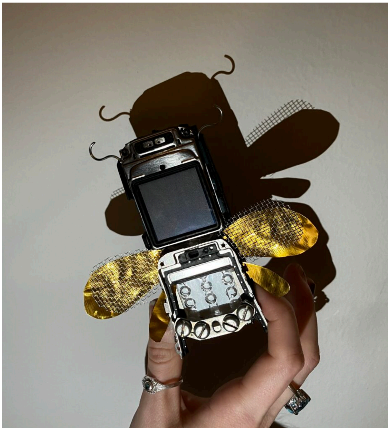
Lietajúci hmyz vytvorený zo starej Nokie (2025)