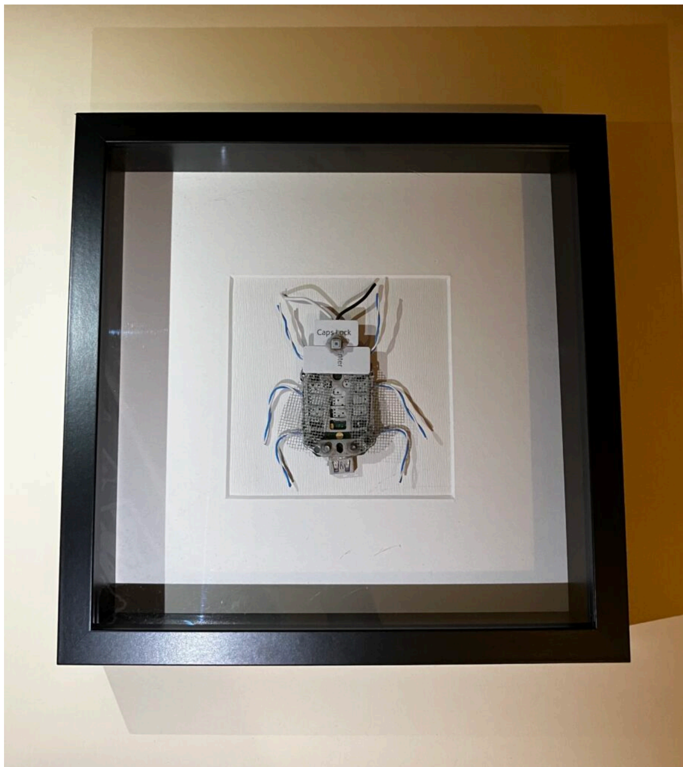
Hovnivál z počítačových a telefónových komponentov (2024)