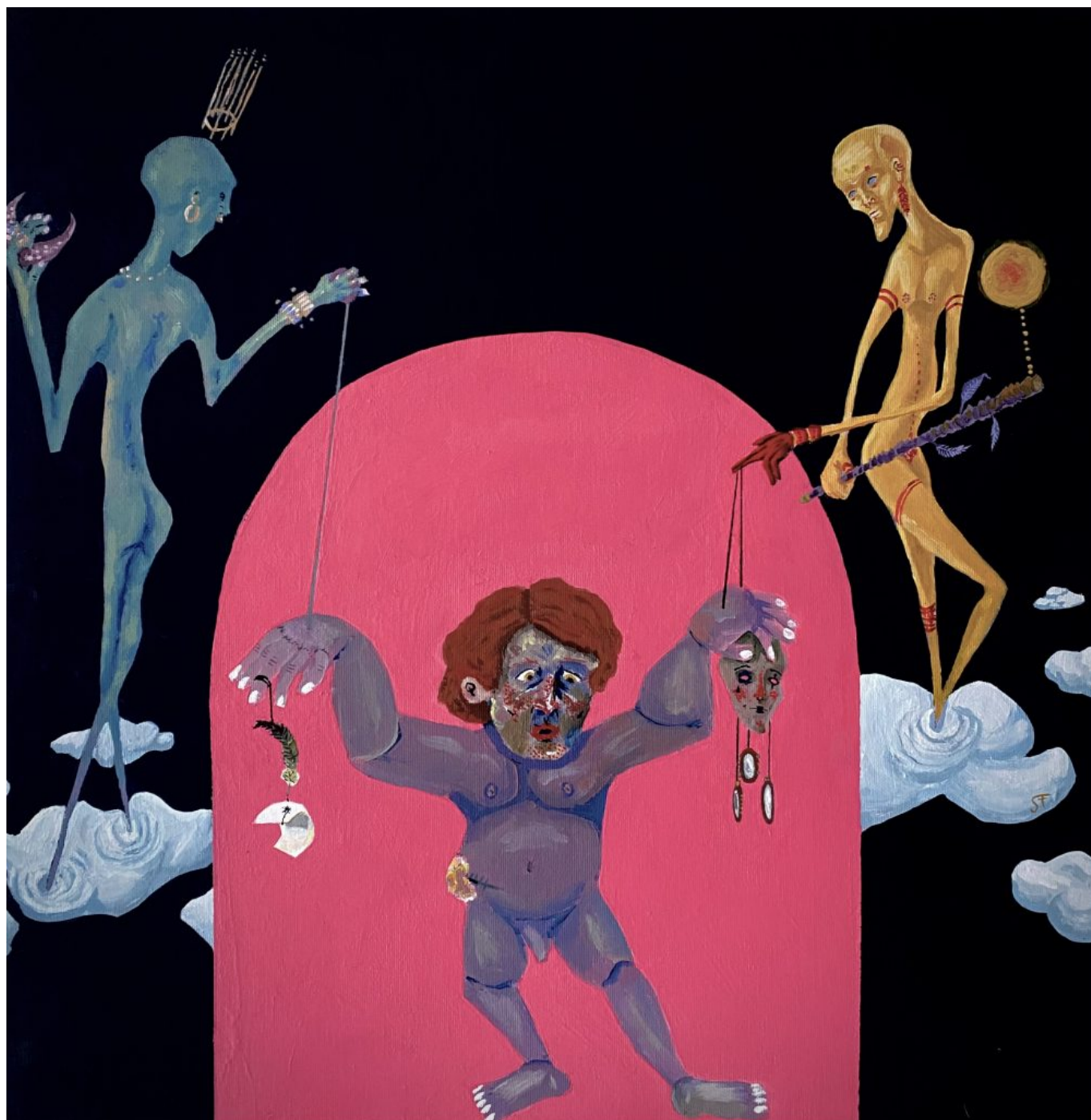
Bábka (kombinovaná technika: akryl a gélové pero, 2020)