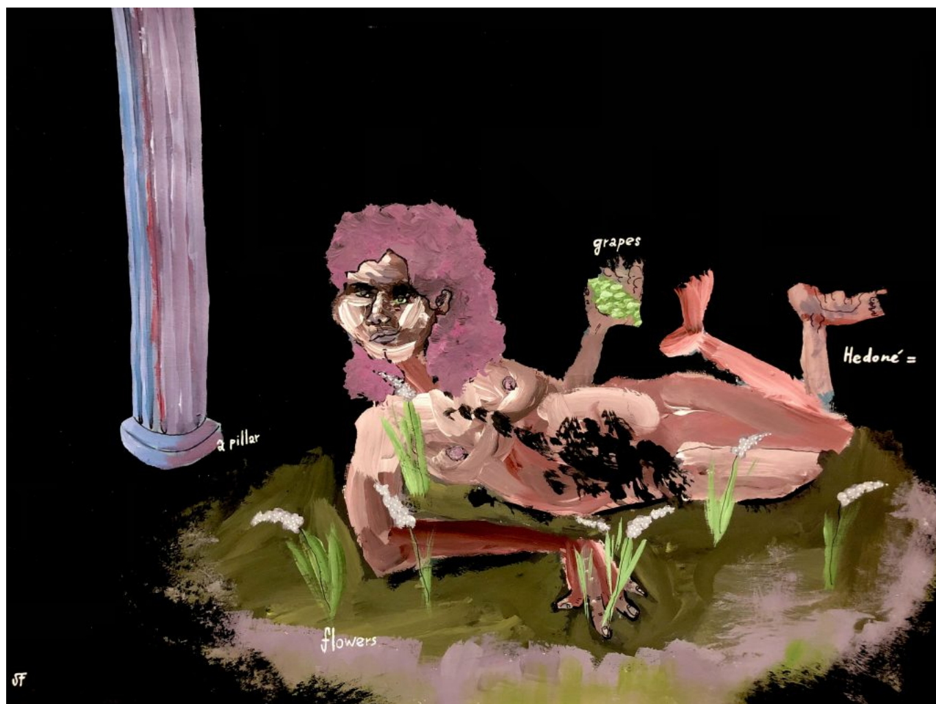
Hedoné (kombinovaná technika: akryl a gélové pero, 2020)

Už je neskoro (kombinovaná technika: akryl a gélové pero, 2020)