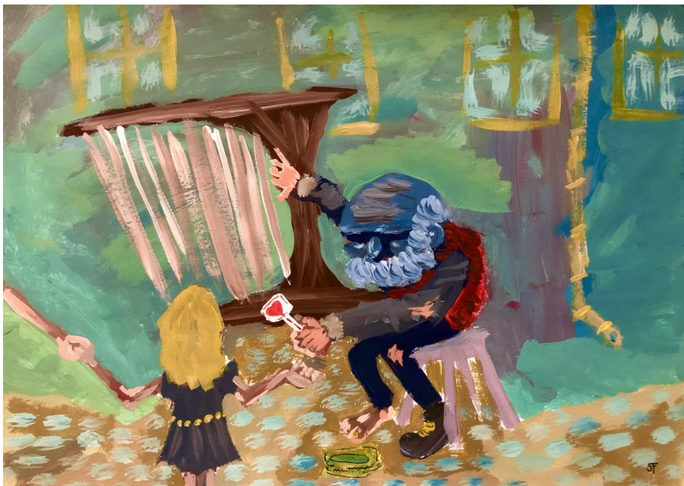
Prešporské ulice: Harfista (kombinovaná technika: akryl a gélové pero, 2020)